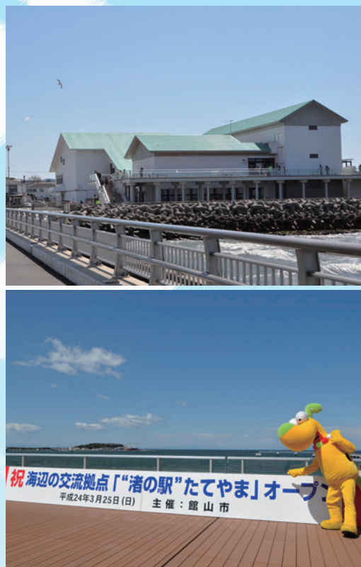
館山市 マスコットキャラクター ダッペエ © studio crocodile・館山市

また、房総のお土産や直売コーナーもある「海のマルシェたてやま」、房総の旬の食材を使用したレストラン「館山なぎさ食堂」もあり、様々な地域・世代の方々が日々訪れています。