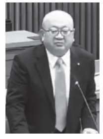
望月 昇 議員 4期目・68歳・北条 新政クラブ (文教民生委員会委員長)