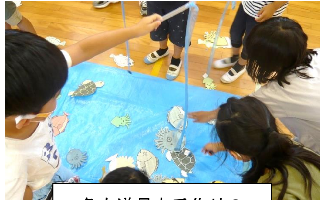
魚も道具も手作りの 「魚釣り大会」