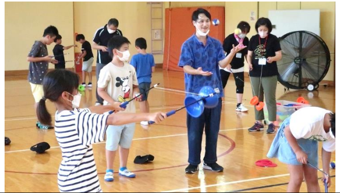
外部講師を呼んで「大道芸」 スタッフも子供たちと一緒に挑戦！