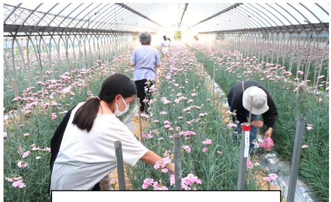
市のバスを借りて みんなでお出かけ！

その他にも、教室ごとに色々なプログラムを実施しています。 学校や家庭ではできない、放課後子供教室ならではの活動も！ 子供たちはもちろん、スタッフにとっても貴重な体験の機会になっています。