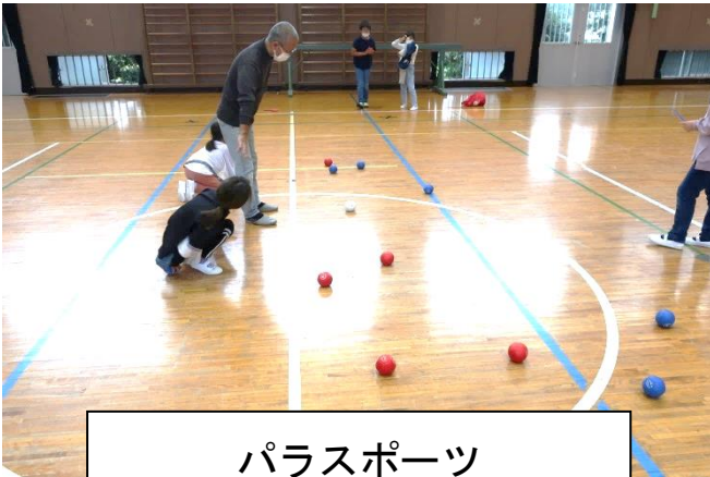
パラスポーツ 「ボッチャ」を体験！