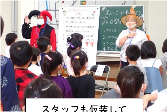
スタッフも仮装して 「英語でハロウィン」