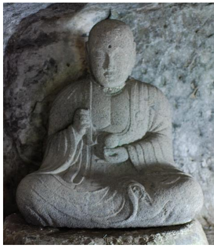
千手院・石造地藏菩薩坐像(市)