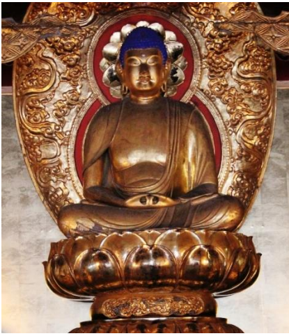
大巖院・木造阿弥陀如来坐像(市)