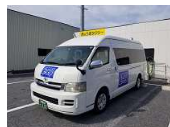
使用車両（ロゴマーク付き） 4