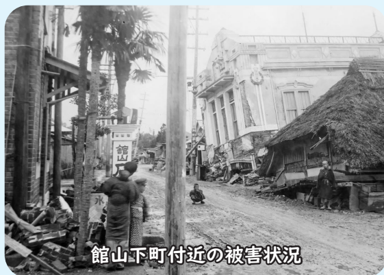
館山下町付近の被害状況

大部分が倒壊しましたが、幸いにも校内での死傷者はいませんでした。この他、住宅の倒壊や道路の陥没・亀裂も至る所で発生し、安房の中心地である館山町・北条町の被害は、その後の人々の生活に大きな影響を与えました。