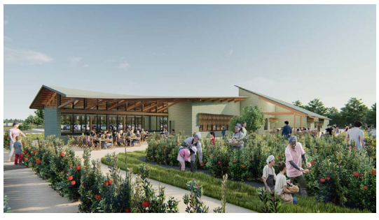
▲完成予想図（北西から）