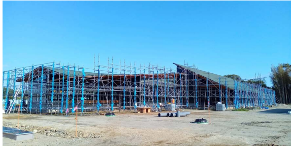
▲外部（北西から） 屋根・外壁が仕上り、外観が実現