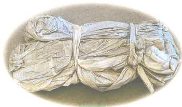
【劣化していない農ビ】