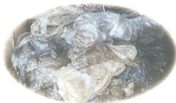
【劣化している農ビ】