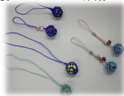
ビー玉ストラップ