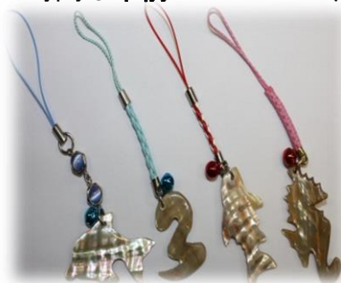
貝殻(アワビ)ストラップ

※参加費は500円です。日程、金額等が変更になる場合があります。ご了承ください。 時間は午前9:30~11:30、午後13:30~15:30の2部制。