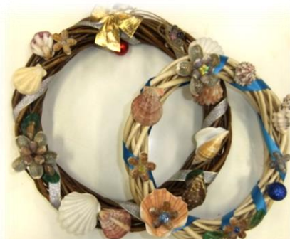
クリスマスリース