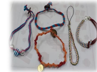
ブレスレット作り

会場: 館山市館山1564-1 “渚の駅”たてやま 海辺の広場 レクチャールーム 申込み・問合せ先: 館山市役所 観光みなと課 0470-22-3606