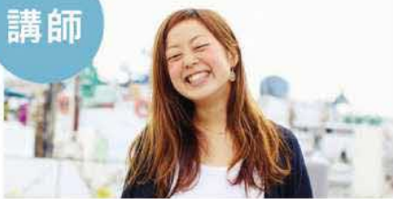
気仙沼市移住・定住支援センターMINATO ターン・コーディネーター 一般社団法人 歓迎プロデュース 理事・「鶴亀の湯・鶴亀食堂」店長 唐桑半島ペンターン女子