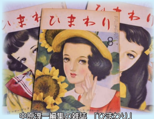
中原淳一編集の雑誌「ひまわり」

挿絵や雑誌編集、ファッションデザインなどで活躍し、今も人気のある中原淳一も、昭和36年（1961）から塩見海岸で療養生活を送りました。快復後、一度は館山を離れたましたが、再び館山に戻り晩年を迎えています。中原淳一は、館山での療養中に浜辺を散歩し、潮騒を聞きながら水平線を眺めたり、漁師と会話する