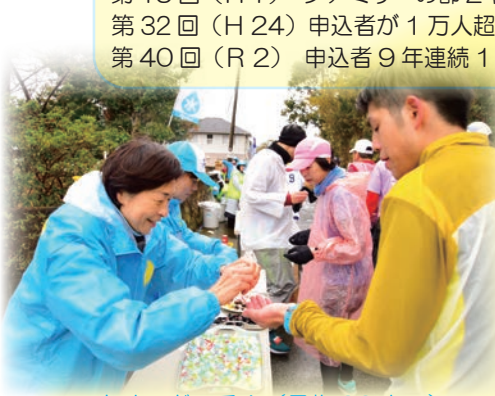
あめ玉どーそ！（見物 32 キロ）