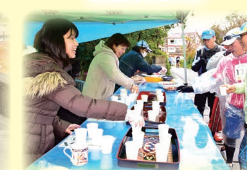
大人気の私設エイド（見物）