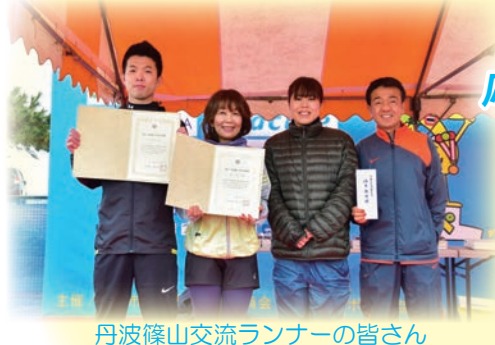
丹波篠山交流ランナーの皆さん

7,815 人のランナーの皆さま 応援・運営サポート・交通規制へ ご協力頂いた皆さま ありがとうございました！ 次回は、2021.1.31（日） 開催予定です