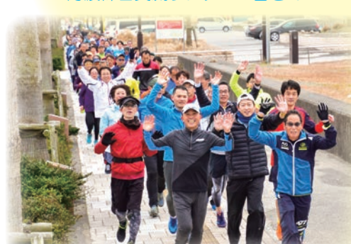
金哲彦さんマラソンクリニック（前日）