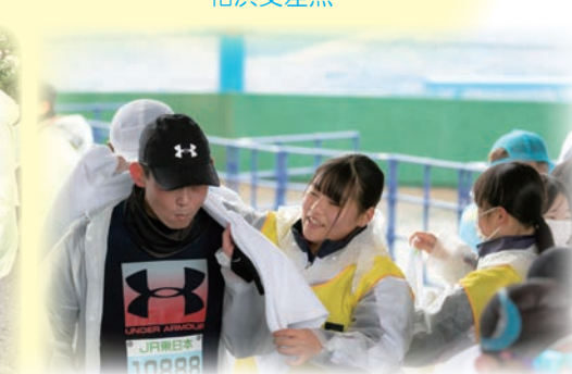
お疲れさまでした