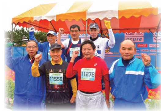
40回連続出場の7人の鉄人