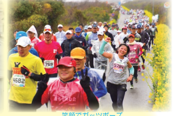
笑顔でガッツポーズ

7,815 人のランナーの皆さま 応援・運営サポート・交通規制へ ご協力頂いた皆さま ありがとうございました！ 次回は、2021.1.31（日） 開催予定です