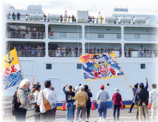
おがさわら丸を見送る人たち