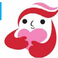
犯罪被害者等支援シンボルマーク ギョットちゃん

犯罪被害者の方やその家族の方が、被害から立ち直り、再び平穏に過ごせるようになるためには、社会全体で犯罪被害者等の方々の思いやり、支えていくことが重要です。