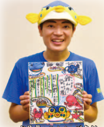
お見舞いのメッセージ色紙 (渚の駅で展示中)