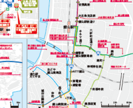
館山駅周辺バス路線拡大図