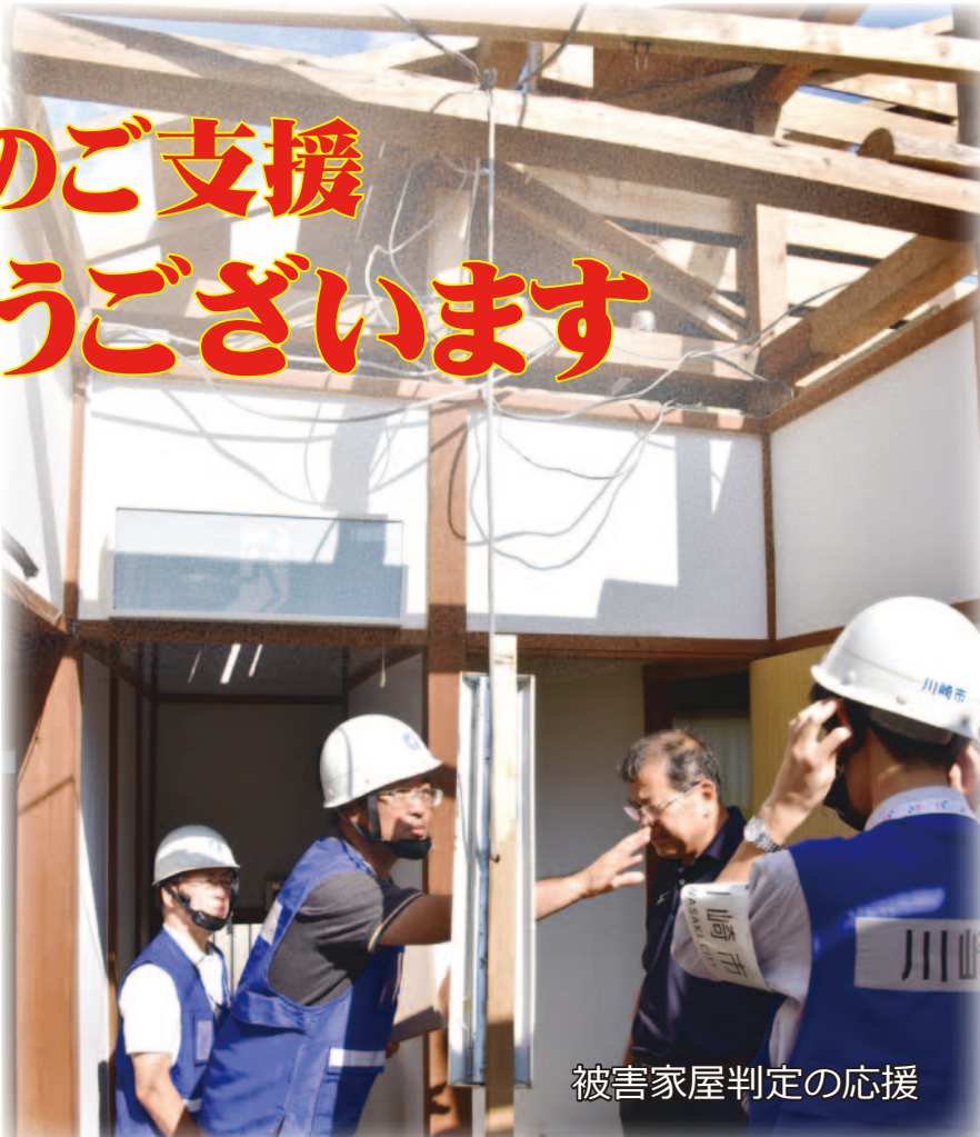
被害家屋判定の応援