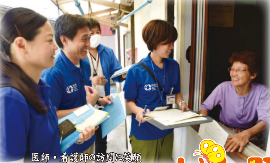
医師・看護師の訪問に笑顔