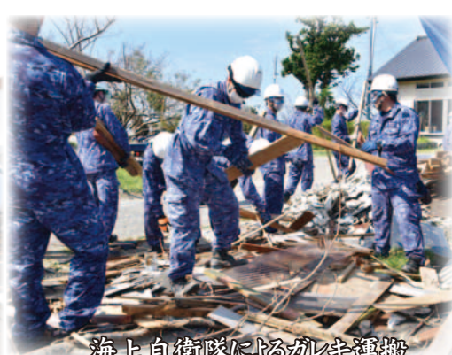
海上自衛隊によるガレキ運搬