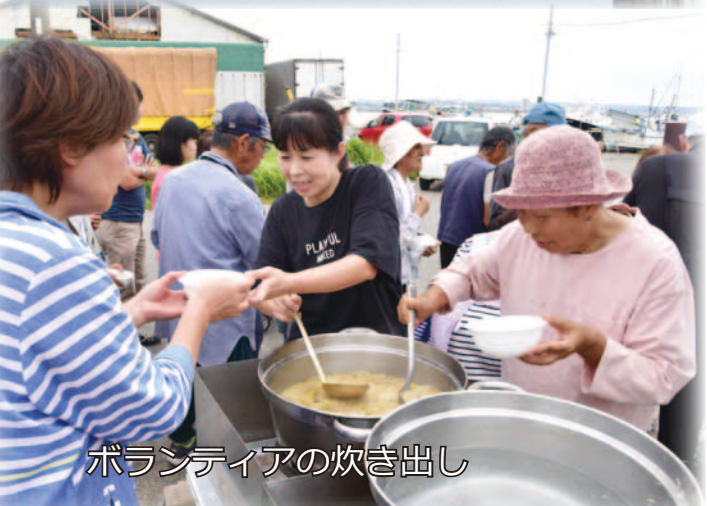
ボランティアの炊き出し