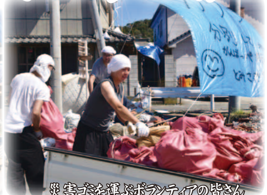
災害支援を運ぶボランティアの皆さん