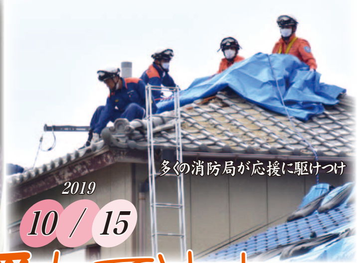
多くの消防局が応援に駆けつけ