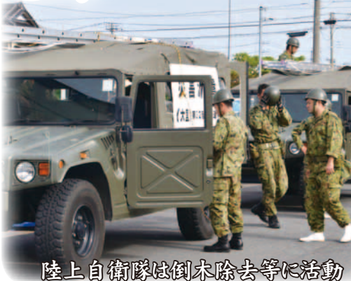
陸上自衛隊は倒木除去等に活動

館山市直営の「鳩山荘」が開業したのは昭和35年7月1日で、県内では第1号の国民宿舎でした。その2年前の昭和33年7月に平砂浦の砂防林が完成したのに続き、8月には房総半島の南部が南房総国定公園に指定されます。