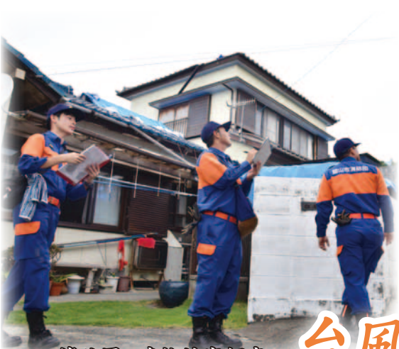
消防団の建物被害調査