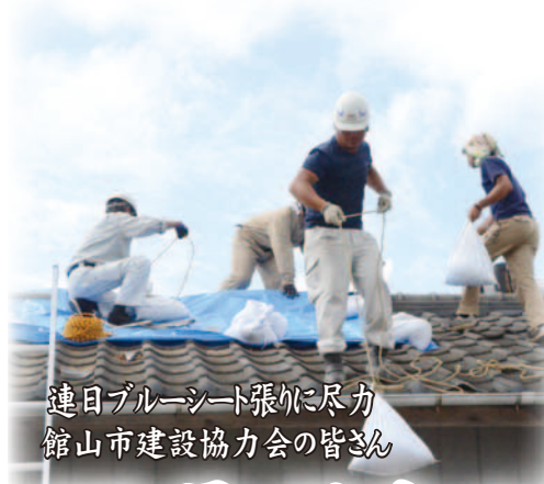
連日ブルーシート張りに尽力 館山市建設協力会の皆さん