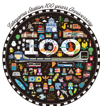
館山駅開業 100 周年 ロゴマーク

消費税引上げに伴い、鉄道やバスの運賃が変わりました。これにあわせ、JRバスと館山日東バスが並走する区間で運賃を揃え、定期券や回数券が共通利用できるようになりました。