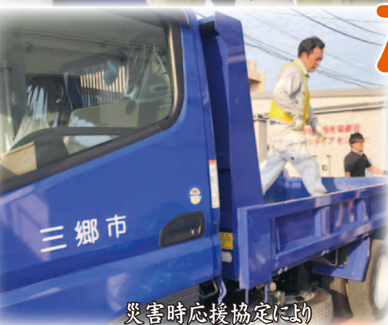
災害時応援協定により