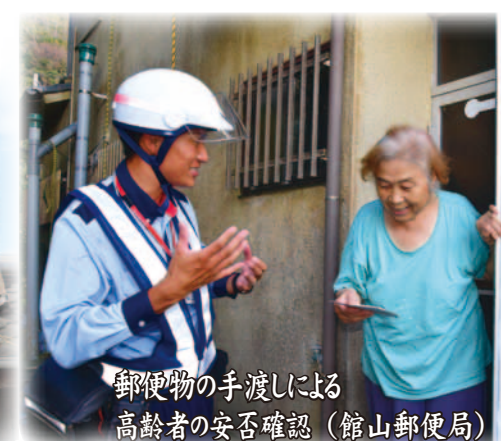
郵便物の手渡しによる 高齢者の安否確認 (館山郵便局)