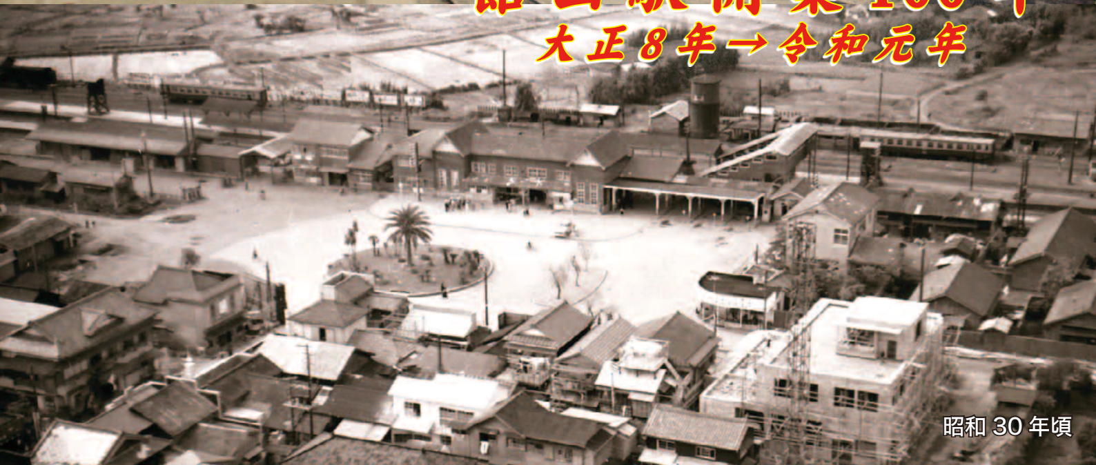
昭和 30 年頃