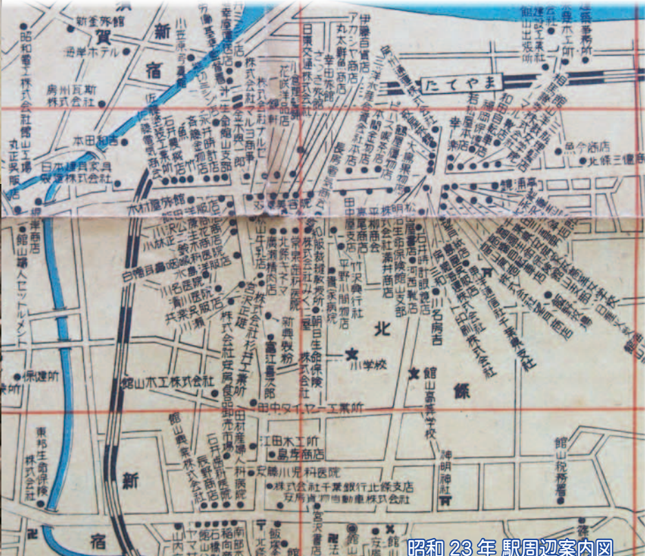
昭和23年 駅周辺案内図