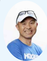
館山マラソン大使 金哲彦さん

開催日/R2.1.26(日)雨天決行 ペースメーカー/3~6時間(15分ごと) ゲストランナー/