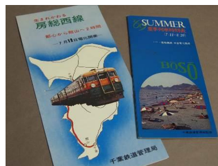
昭和 44 年（1969） 房総西線（現内房線）電化関係資料

館山駅は大正 8 年（1919）に「安房北条駅」として開業しました。その前年には那古船形駅、大正 10 年（1921）には九重駅が開業しています。鉄道の開通は、商品流通や観光客の増加をもたらし、駅周辺が町の中心として賑わいの場となりました。当時の写真・地図のほか、駅で使用された懐かしい看板などを展示します。