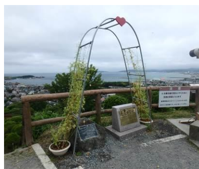
晴れた日には富士山も望める、人気の撮影スポット