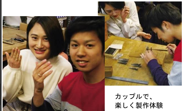
カップルで、楽しく製作体験

市内のカフェでは、新作スイーツを開発。ハートの焼き型を使った「恋する♥ワッフルセット」を新メニューとし、カップルで来店した方にはハートクッキーをプレゼントしています。 ※館山市「恋人の聖地」活用支援事業補助金による事業展開