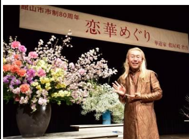
假屋崎先生の見事な生け花に魅了される