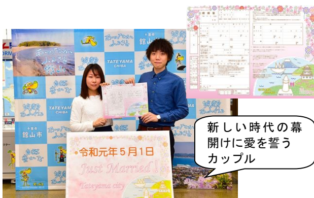
新しい時代の幕開けに愛を誓うカップル

市内の隠れた魅力スポットやカフェなどを市の若手職員が選び、紹介したガイドブック「たてやまぶら散歩」は好評につき増刷を実施。「のんびり・ゆったり」をコンセプトに、館山の新たな魅力を紹介しています。