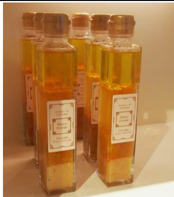
地元産の食材にこだわり、おしゃれでおいしいジャムやドレッシングを開発されています

市内の彫金工房では、「ふたりでつくるオリジナルシルバーリング手作り体験」を開始。海辺の工房でゆったりとした時間を過ごしなが、世界に1組だけのペアリングを作るプログラムとして人気となっています。 ※館山市「恋人の聖地」活用支援事業補助金による事業展開