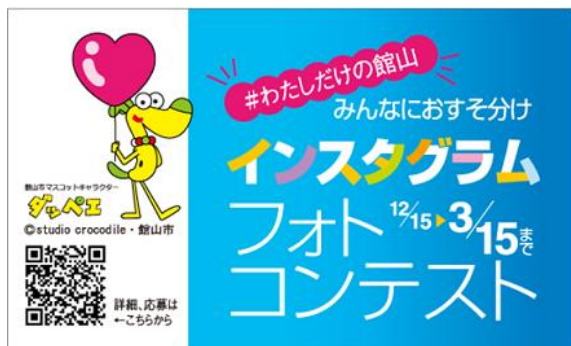
合言葉「#わたしだけの館山」を付けて応募！

市内の旅行会社では、3箇所の恋人の聖地スポットを巡る星空婚活ツアーを実施。男性17名・女性15名が参加し、12組のカップルが成立しました。 ※館山市「恋人の聖地」活用支援事業補助金による事業展開