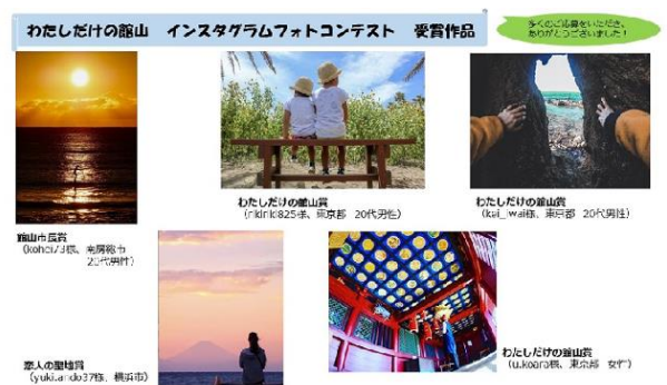
魅力あふれる作品の数々に、選考もひと苦労

「わたしだけの館山 みんなにおすそ分け」をコンセプトに実施したInstagramフォトコンテストでは、3ヶ月の応募期間中に800件を超える応募があり、館山の新たな魅力を伝える作品が多数寄せられました。