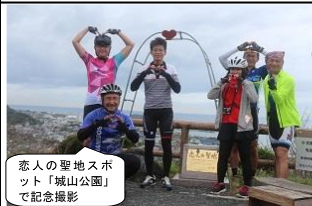
恋人の聖地スポット「城山公園」で記念撮影

令和の幕開けに合わせて婚姻届を提出するカップルを祝福するため、オリジナル婚姻届のデザインをあしらったバックボードを準備し、記念写真や市長からのメッセージをプレゼントするなどの「おもてなし」を行いました。