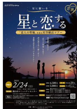
スイーツづくりや聖地めぐり、星空観察で参加者の距離が一気に縮まりました

市内でジャムやドレッシングを製造・販売している工房では、オレンジの花言葉「花嫁の喜び」にちなみ、地元産品のカレンデュラ（キンセンカ）を使用したハッピーオレンジドレッシングを開発し、販売しています。 ※館山市「恋人の聖地」活用支援事業補助金による事業展開