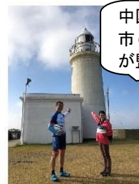
中国語版は、館山市の台湾人職員が監修

サイクリングファミツアー実施に当たっては、中国語のパンフレットを製作し、恋人の聖地スポットをはじめとするコース上の観光スポットなどをくまなく紹介し、参加者に伝えました。