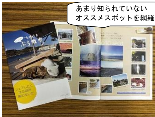
あまり知られていないオススメスポットを網羅

城山公園（展望エリア）にある、恋人の聖地銘板の周りに、ハートの形をした実がなるフウセンカズラの鉢を設置し、訪れた方が、実を自由にお持ち帰りいただくような取り組みを行いました。