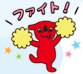
チーバくん画像の一例