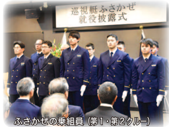
ふさかぜの乗組員（第1・第2クルー）

韓国語など多言語で表示可能な「停船命令等表示装置」を導入するなど、初代「ふさかぜ」にはなかった最新鋭の機能となっています。