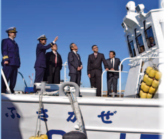
機関長から説明を受ける見学者

搜索能力向上のため、夜間でも赤外線で人を感知する「夜間監視装置」を搭載、さらに操舵室の外壁に英語、中国語、