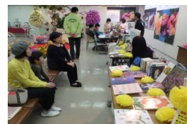
フラワーフェスタ2018 in たてやま