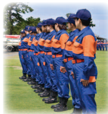
規律訓練「右へならえ」