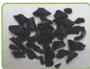
実際に見つかったゴムの混入物

製造過程でゴムは比重が塩ビと近く金属探知機にも反応しないため、除去が困難です。排出物に、 ゴム等が混入することの無いよう、周知徹底をお願いいたします。