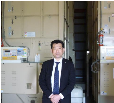
「安全安心でおいしい米をご提供します」

農業の生産人口が減少していく中で、農地所有適格法人としての位置づけを明確にし、地に足をつけ、地域になくてはならない存在になっていけるように、活動していきたいと考えています。