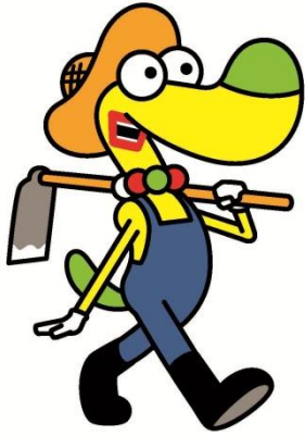
館山市マスコットキャラクター © studio crocodile・館山市