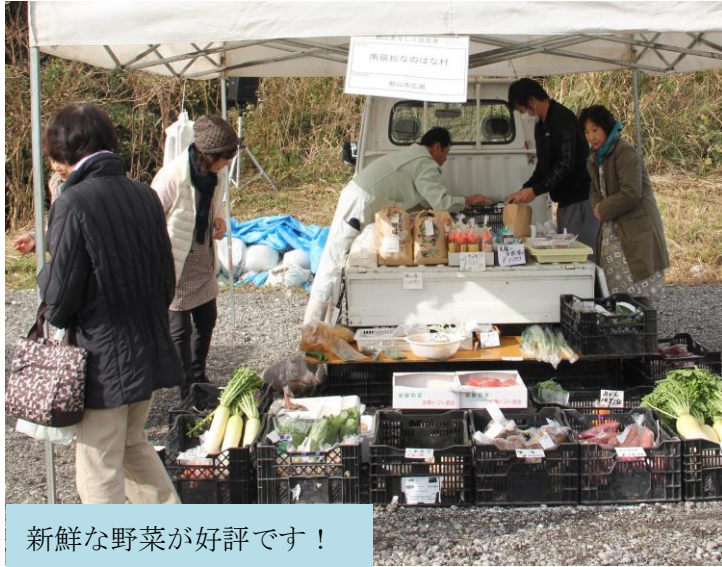
新鮮な野菜が好評です！

私たち「さとみ軽トラ市実行委員会」は、地産地消の取組みの一つとして「館山まるしえ」を開催しています。場所は、稲市有地の特設会場です。 地元産の旬の新鮮な野菜・果物の直売や、旬の食材を使った軽食・惣菜等が人気です。また、同時開催でフリーマーケットを行っています。 「さとみ軽トラ市実行委員会」では、よりの多くの農家の皆さまの出店を呼びかけており、常時出店登録の募集受付をしています。平成29年度は年6回、奇数月に開催しました。興味のある方は、館山市農水産課食のまちづくり係（29・5385）までお問い合わせください。