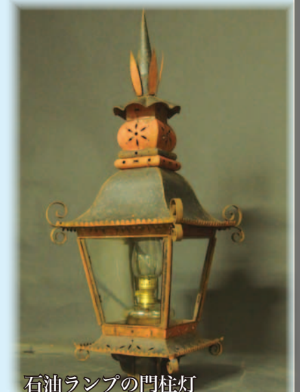
石油ランプの門柱灯

一方、那古地区小原の一部では、昭和20年(1945)に初めて電線が架設されるなど、安房全域で配電が完了するのは第二次世界大戦後になってからでした。電灯の普及までは、石油