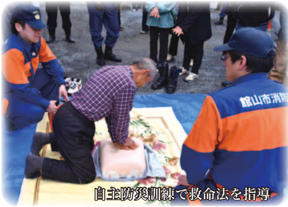
自主防災訓練で救命法を指導

この状況は、住民の安全安心に関わる大きな課題となっています。対して消防団では、自主防災会や学校の防災訓練、町内会のイベントなどへ積極的に参加し、地域の皆さんと交流することで防災力の向上に努めています。これらの活動をを通じて消防団への理解を深め、身近な存在に感じてもらうことで、団員の確保に繋げようとしています。