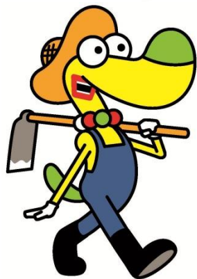
館山市マスコットキャラクター © studio crocodile・館山市