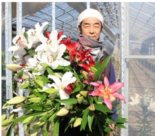
「白やピンクの大輪の品種が人気です！」

54歳。太田農園代表で、ユリ以外には千両を栽培。ユリの忙しさから解放される夏は、趣味のサーフィンを楽しむ。