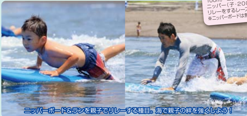
ニッパーボード&ランを親子でリレーする種目。海で親子の絆を強くしよう!

ルール ラン(親・100m)→ラン(子・100m)→ニッパー(親・200m)→ニッパー(子・200m)の順でリレーをするレース。*ニッパーボードは無料貸出し有り。