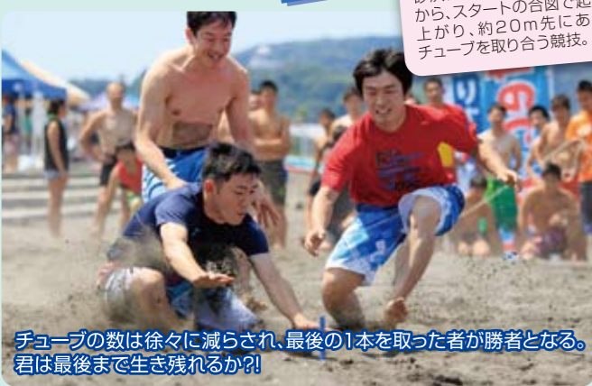
チューブの数は徐々に減らされ、最後の1本を取った者が勝者となる。君は最後まで生き残れるか?!

ルール 砂浜に後ろ向きで寝た状態から、スタートの合図で起き上がり、約20m先にあるチューブを取り合う競技。