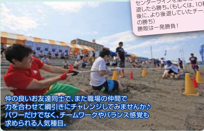
仲の良いお友達同士で、また職場の仲間と力を合わせて綱引きにチャレンジしてみませんか? パワーだけでなく、チームワークやバランス感覚も求められる人気種目。

ルール 3人1チーム。センターラインを基準に1m後退したら勝ち。(もしくは、10秒後に、より後退していたチームの勝ち) 勝敗は一発勝負!