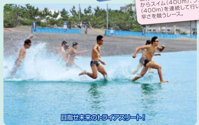
目指せ未来のトライアスリート!

ルール 波打ち際のスタートラインからスイム(400m)、ラン(400m)を連続して行い、早さを競うレース。