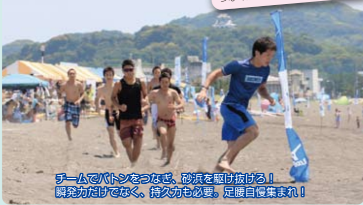
チームでバトンをつなぎ、砂浜を駆け抜ける! 瞬発力だけでなく、持久力も必要。足腰自慢集まれ!