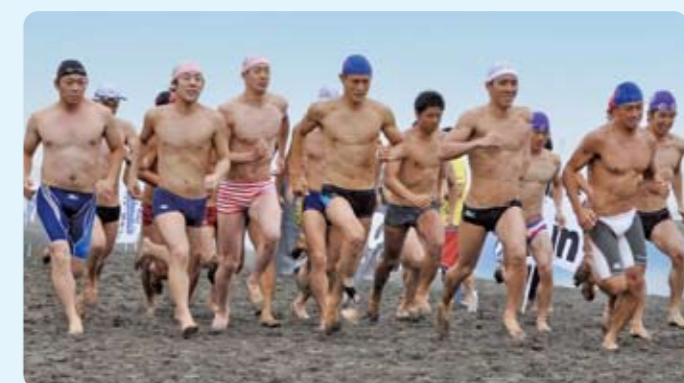
人命救助のレベルを上げる為につくられた競技、ライフセービング。全国から集う海の猛者たちが、オーシャンアスリートNo.1の座をかけて戦う。命を守るアスリートの真闘勝負は必見の価値あり!!

【種目】アウトリガーカヌー、ビーチリレー、ビーチ綱引き、オーシャンズサバイバル、オーシャンズリレー