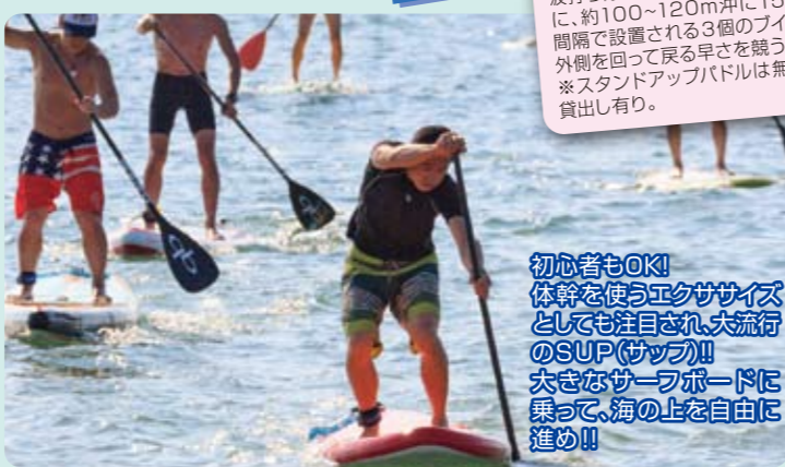
初心者もOK! 体幹を使うエクササイズとしても注目され、大流行のSUP(サップ)!! 大きなサーフボードに乗って、海の上を自由に進め!!

ルール 波打ち際をスタート・フィニッシュに、約100~120m沖に15m間隔で設置される3個のブイの外側を回って戻る早さを競う。*スタンドアップパドルは無料貸出し有り。