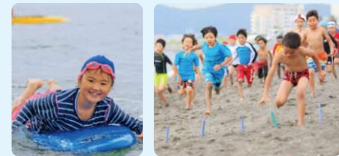
トップライフセーバー飯沼誠司氏によるプログラムが、今年も北条海岸にやってくる。海での正しい遊び方のレクチャーを受けて、海の楽しさを体全身で感じよう! ニッパーボード、ロングビーチフラッグス、ラン・スイムを体験して競技にも参加しよう!