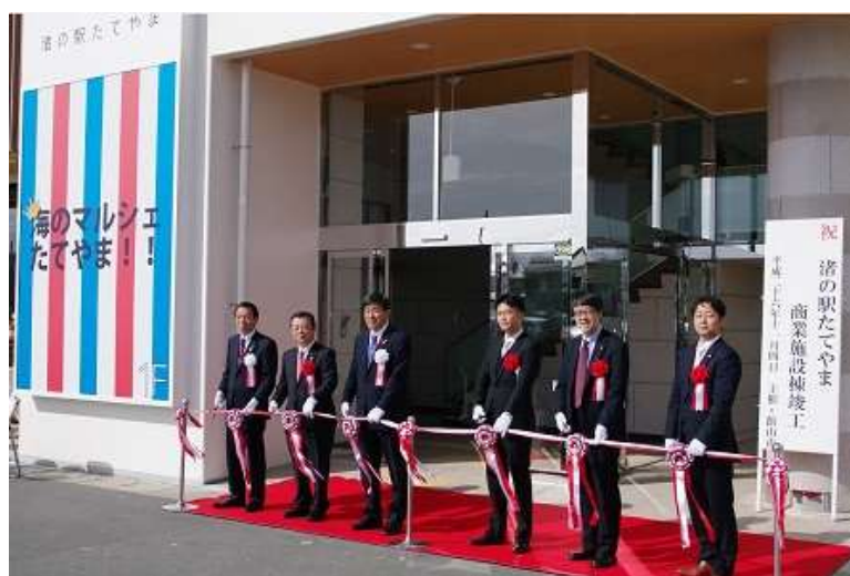
渚の駅たてやま 商業施設棟 オープン