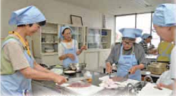
前期推進員の活動の様子