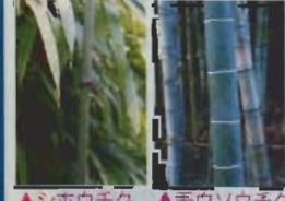
▲シホウチク ▲モウソウチク

市内を流れる汐入川、平久里川、巴川など、川の流れに沿ってやぶをつくるマダケ(女竹)の河畔林が見事である。 マダケは、稈(茎)の高さ3~7メートル、径は1~2センチで、葉先は垂れる。二名、カワタケ、ニガタケともいい、節は独特の苦みもち食用に、稈は古舞竹として建築用に使われてきた。 山に生えるマダケの中のダイ