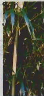
▲マダケの河畔林 (作名川)

市内を流れる汐入川、平久里川、巴川など、川の流れに沿ってやぶをつくるマダケ(女竹)の河畔林が見事である。 マダケは、稈(茎)の高さ3~7メートル、径は1~2センチで、葉先は垂れる。二名、カワタケ、ニガタケともいい、節は独特の苦みもち食用に、稈は古舞竹として建築用に使われてきた。 山に生えるマダケの中のダイ