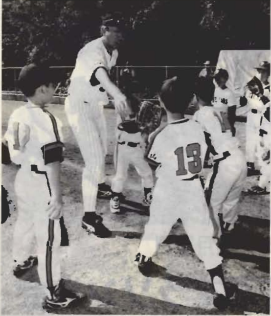
「相手の胸をめぐけて投げて」とコーチから基本の指導