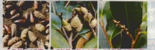
▲スタジイの実 ▲2年目の熟した実 ▲1年目の若い実