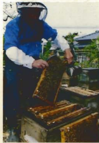
▲薫煙機で煙を掛けながら作業をします

今は、一家で花を追いながら移動することはなくなりましたね。日本中どこへ行っても、高速道路が整備されていますからね。女房と子供は家において、一人で行くんですよ。トラックにミツバチの箱を積んで行って、箱だけを置いて自分も帰ってしまふんです。 昔はね、私も女房と子供を連れて、東北、北海道まで行きましたね。栃木の菜の花、レンゲに始まり、福島、山形、青森、北海道。サロマ湖にテントを張って、ミツバチを放すんですよ。家族全員の手入れを仕入れて行くんです。2週間程、暮らすんですからね。上の子供が、小学校に入るまでやっていましたよ。昭和30年代頃には、養蜂業者は、みんなこうやっていました。