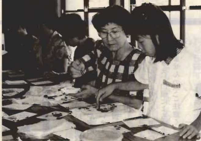
八幡青年館で始まった「寺子屋アカデミア」

八幡区の青年館で、区民なら誰でも受講でき、講師も特技を持った区民自らが務めるという「寺子屋アカデミア」が開講しました。母親に連れられた子どもたちも参加し、自分の好きな講座を気軽に楽しめるとあつて、区民に人気を呼んでいます。