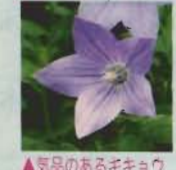
▲気品のあるキョウ