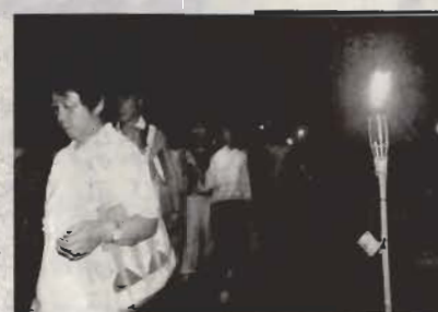
帰路につく観客の足下をやさしく照らすサークル連絡会のたいまつ灯

新能が終わると、帰路につき観客のみなさんは、ゆらゆらと揺れる「心の灯」に見送られながら、幽玄の世界の余韻を楽しんでいました。