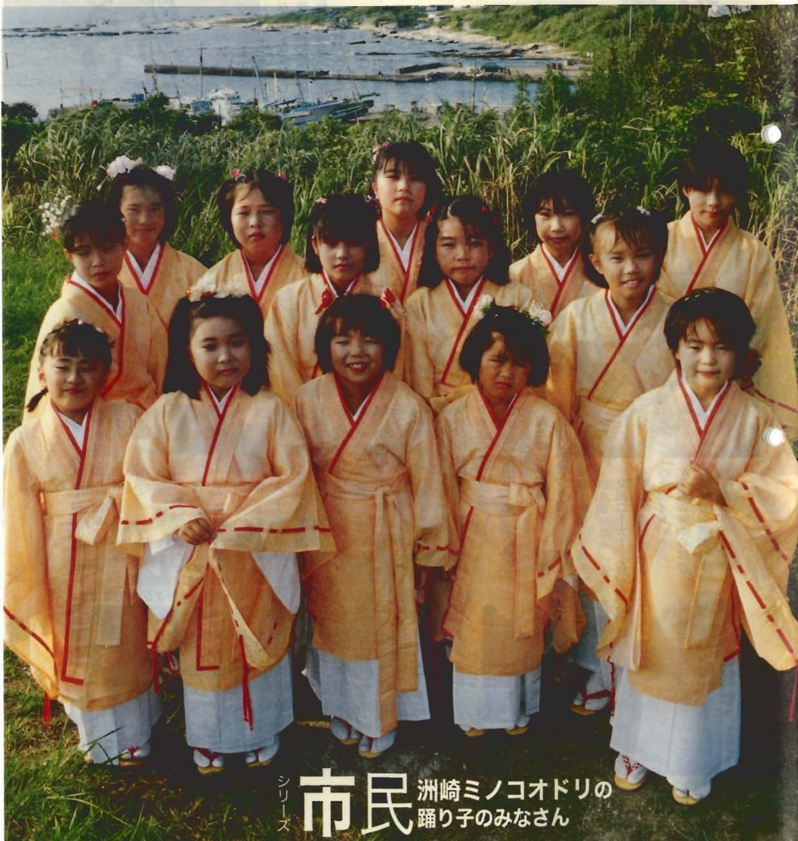
シリーズ 市民 洲崎ミノコオドリの踊り子のみなさん