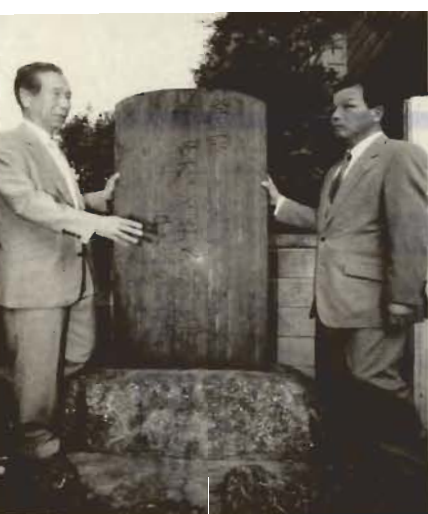
記念碑を訪れた瀬戸篠山町長(右)と庄司市長