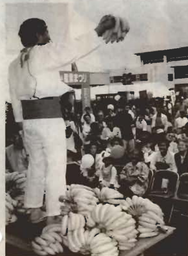
名調子「バナナのたたき売り」