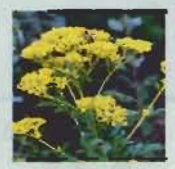
▲小粒の花の集まるオミナエシ