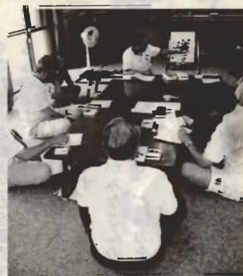
囲碁教室はお父さんたちに大人気

「市民の広場」への投稿をお待ちしています。身近な情報をお寄せください。このページは館山市のホームページにも掲載されています。掲載された写真を希望の人は、秘書広報課（022-3111内線505）までご連絡ください。