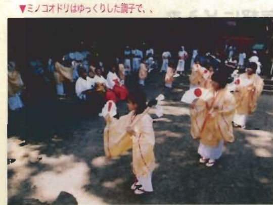
▼ミノコオドリはゆっくりした調子で、

中学生になると、高校受験があるので、踊りに参加するのも難しくなっているようです。それに子どもが減っていますからね。ミノコオドリを保存しようとする仲間も、昔からいました。近年、学者とか研究者、報道関係者などから、ミノコオドリや洲崎の風俗、歴史などをいろいろ聞かれることが多くなってきたんです。しかし、その由来やら歴史という