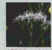
▲香気をおつフジバカマ