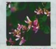
▲枝もたむけに咲くハギ