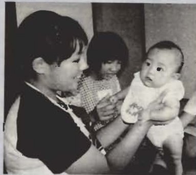
子育てって大変ですね

たり、衣服の着脱に挑戦し、一足早いお父さん、お母さん体験しました。 「赤ちゃんにふれてみたくて参加した」という生徒たちは、午前中に保健婦などによる講義やビデオ上映で、赤ちゃんの誕生や命の大切さなどを学び、午