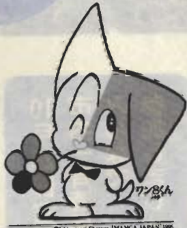
●マンガ共和国のために 石ノ森さんが描いた ワン8 (パチ)くん

漫画界の第一人者で、「サイ ボーグ009」や「仮面ライ ダー」など数多くの作品を手が け、私たちに夢を与えてくれた 故石ノ森章太郎さんへ、漫画で メッセージを贈ってみませ んか。