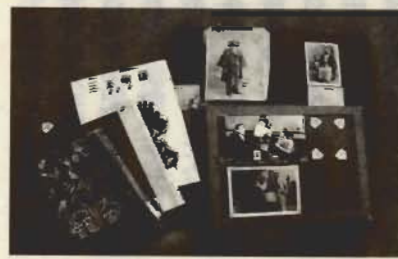
寄贈された資料の一部

●青木茂(写真一番右:名郷浦バス停前で)児童文学作家。東京麻布生まれ。昭和21年、雑誌「赤とんぼ」に「かっぱの三太」等の作品を発表し始め、以後、続々と『三太物語』シリーズを書き続ける。昭和25年『三太物語』がNHKラジオで放送。子どもから大人まで大人気を博した。館山を活動の拠点に/大正元年、15才の冬に療養のため館山の城山の下に家を見て大正14年まで生活。その後、福島、東京へ移住。昭和34年、62才のときに東京世田谷の自宅を引き上げ、再び館山へ。波佐間の名郷浦海岸へ移り住み、文芸活動に打ち込む。昭和57年3月、館山の地で没するまでこの地で暮らした。昭和58年、遺族より館山市図書館へ絵画など1400点もの資料の寄贈を受ける。