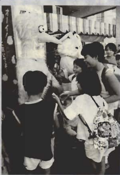
「握手してください」とぬいぐるみに握手を求めた子どもたち

「道の日」は大正9年に最初の道路改良計画が実施されたことを記念する日。昨年まで市道沿いの草刈作業を行ってききましたが、市民一人ひとりへの啓発が大切とキャンペーンを企画。館山駅前では2グループが合流し、道行く人たちに啓発チラシやウサギのお面などを配布。ぬいぐるみの周りには子どもたちが集まり、握手を求められるなど大入り。参加した人や会員も「これで、みんなが少しでも道に関心を持ってくれればいいですね」と話していました。