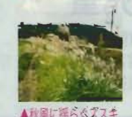
▲秋風に揺るアスギ