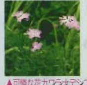
▲可憐な花カララナテンコ

庭先や道端、田畑、野山、海岸などに秋の花が咲き始めた。昔から秋の七草には、花に風情のあることや可憐さからハギ(萩)・ススキ(芒)・クズ(葛)・カララナテンコ(河原撫子)・オミナエシ(女郎花)・フジバカマ(藤袴)・キ