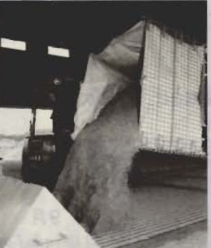
希望者にはメッシュコンテナの貸し出しも行い、搬入も便利に