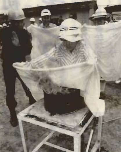
消防署職員の指導による初期消火訓練

「防災の日」の1日、房南中学校校庭を会場に合同防災訓練が行われ、約千三百人の市民が参加し、本番さながらの訓練に取り組みました。