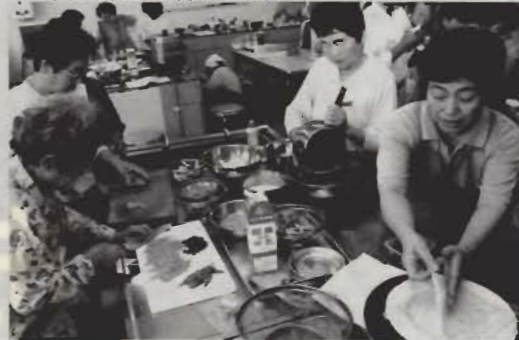
●牛乳を使った料理に挑戦

集会所で行われるときは、手ぬぐいを使った「演歌体操」が始まりの合図。「いろいろ試したけど、「浪花節だよ人生は」