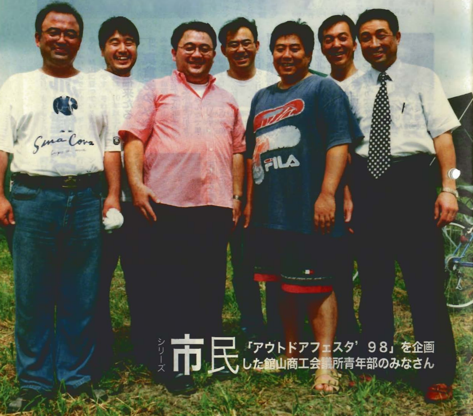
シリーズ 市民「アウトドアフェスタ'98」を企画した館山商工会議所青年部のみなさん