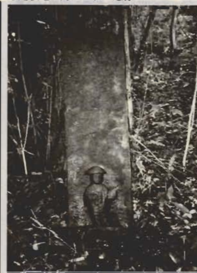
●尾根道に建てられた道標

山の中の道しるべ 巡礼姿の道標 山道をイメージしてみてください。急な坂道と曲がりくねった道が思い浮かぶでしょう。現代の山道は谷を奥へ奥へと入り、行き詰まったらトンネルか急な山越えの道になることが多いので、そんなイメージになるようです。しかし、昔の山道を歩いてみると、丘陵先端から徐々に