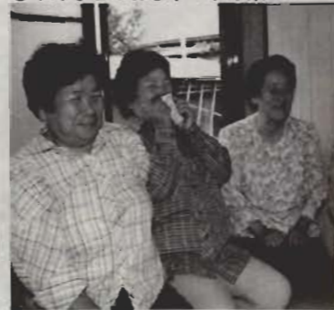
●みんなのおしゃべりも楽しい

「これから夏にかけて盆踊り大会、秋にはやきいも大会、冬にはお飾りづくりを計画しています。3年目を迎えて、この頃、一人ひとりが私たちの会という意識が芽生えてきましたね。広い地域なので、話をしたり、顔を見ることがみんな楽しみなんです。これからもずっと続けていきたいですね」