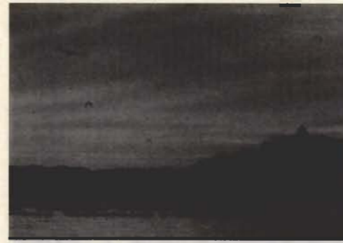
●優秀賞「鏡ヶ浦浜木綿の咲く頃」(3枚組の中の1枚)