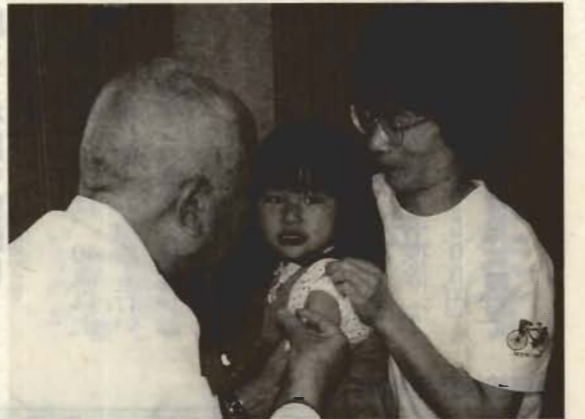
診察、体温計、筆記用具 問合せ/保健センター（電話 23-3113）

接種の方法は、保健センター（コミュニティセンター2階）を会場に行う「集団接種」と市が委託している医療機関で期間内に個人ごとに接種を行う「個別接種」があります。 転入等で通知の届かない人は、個別接種で受ける予防接種については、母子健康手帳を持って保健センターまで予約票を取りに来てください。集団接種で受ける予防接種は、当日会場へ直接来てください。 料金/無料 持ち物/母子健康手帳、予防接種券