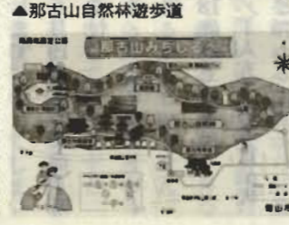
▲那古山自然林遊歩道