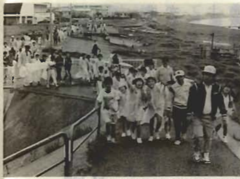
▲みんな元気に力強く歩きぬいた昨年の市民歩こう会から

申込方法/5月27日(月)までに、住所、氏名、年齢、性別を書いて、はがきか電話で市教育委員会スポーツ課(〒294北条1-45-1 ☎22-3111)