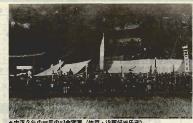
▲大正2年の競馬の記念写真

竹原の競馬 九重地区竹原の目枝神社の前には、東西に300mほどのびた、見通しの良い直線道路がありました。ここはかつて芝地で、大正時代頃まで競馬を行う馬場になっていました。 競馬は10月9日と10日に、目枝神社例祭の恒例行事として行