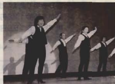
▲軽やかなリズムをタップダンスでさみませます(市民センター会場) ▲サークルがボランティアで指導した中学生作品の粘土細工

公民館や菜の花ホールで活動している各種サークルのほか、光の子学園や館山聾学校、館山養護老人ホーム、サークルがボランティアで指導した第二中学校の生徒作品など83団体が参加。