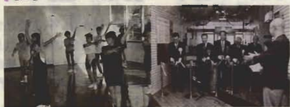
▲身体全体で呼吸しているようなエアロビクス ▲テープカットで華やかに開場

第12回サークルフェスティバルが3月2日(土)・3日(日)の両日、コミュニティセンターと市民センターの2会場で開かれ、日頃の活動成果の発表と親睦をかねて自慢の作品や実演を披露しました。