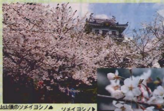
城山山頂のソメイヨシノ ▲ ソメイヨシノ

イヨシノ470本は、この後間もなく咲く。館山測候所によると今年、開花日(数輪が開花)は3月31日、花の見頃の満開日(80%咲き揃う)は4月8日である。ソメイヨシノは、オオシマザクラとエドヒガンの雑種で、江戸末期に江戸の染井村の植木屋が日本全国に広めたといわれる。ここでは、サトザクラが最後を飾って咲く。