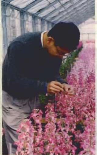
◀ピンセットを使って交配させる こまかい作業は根気のいる仕事。 新しいストックを作るには長い年月が必要です