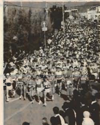
▼フルマラソンスタート直後、人・人・人……壮観です

先月28日、第16回を迎えた館山若潮マラソン大会が、快晴無風の絶好のマラソン日和で行われました。 「光り輝く館山の鏡ヶ浦を渡る風を追い抜いて、力いっぱい走ります」元氣いっぱい選手宣誓の後、南房総の自然豊かなコースに向けてフルマラソン、10*、ファミリーの部がそれぞれスタートを切りました。 これまで最多の5,147人の選手が健脚を競い、10*は高校生男子の部1位・2位と10*は女子の部、フルマラソン女子の部で大会新記録が生まれました。