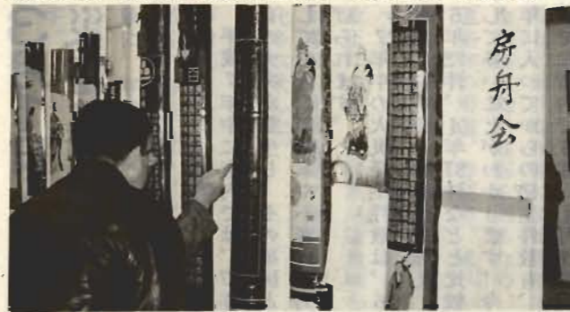
●コミュニティセンター会場/中央公民館からの参加サークル