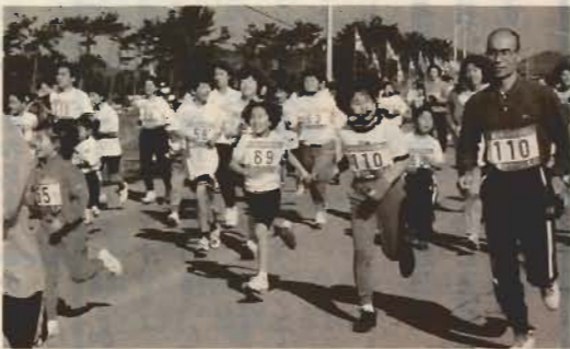
▼2kmのファミリーの部