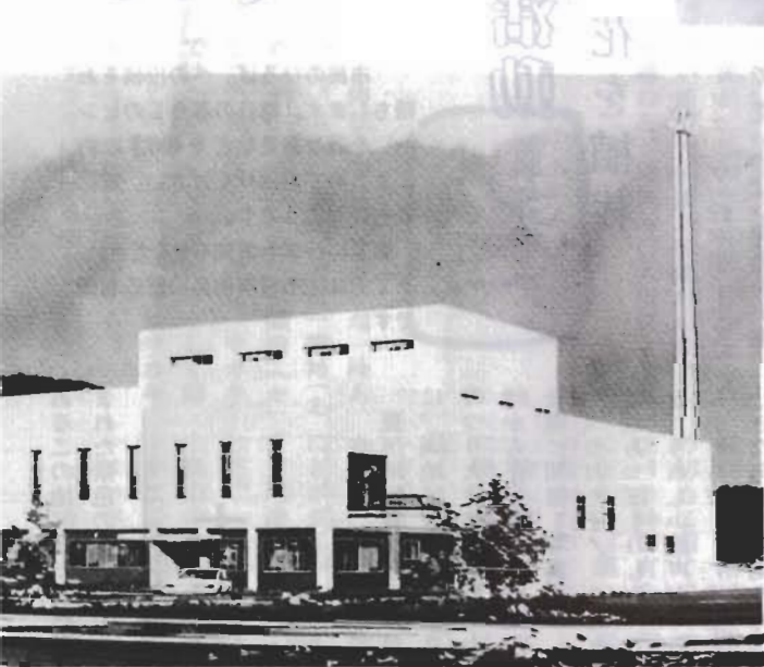
出野尾に建設するごみ処理場の完成予想図

清潔で住みよい生活をのぞむわたくしたちにとって、一日もゆるがせにできないごみ処理。現在の正本処理場はいたみがひどく、しかも出るごみは処理能力の限界を超えています。新しく建設する清掃センターは、今年度から三年間で出野尾に建設します。近代的な設備をそなえ、公害防止、周囲の美観・緑化などを十分に配慮してあります。秋に着工し、五十九年夏完成の予定です。