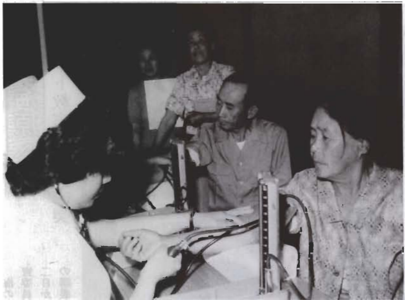
今年、初めて実施した館野地区の総合検診。結核、胃、循環器などの検診をまとめて同時に行い、検診効率を高めず。

今年度の国民健康保険税の税額が決まりました。平均税額は、一人あたり三万六千円。一世帯あたりでは九万七千円。昨年度に比べて二世帯平均二・九%の引き上げです。また、二十六万円だった最高限度額を二十七