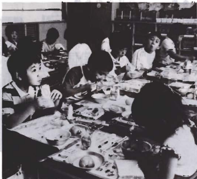
楽しく給食をとる児童たち(館山小で)

答え 音楽を聞きながら情緒ある雰囲気の中で食事することや、週三回の米飯、パンの特殊加工など児童、生徒が喜んで食べるよう、食材料の購入、調理に工夫をこらしている。食器具