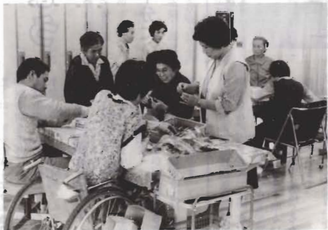
毎日の作業が楽しみ、という入所者の話を聞き、作業を手伝う親の会会員