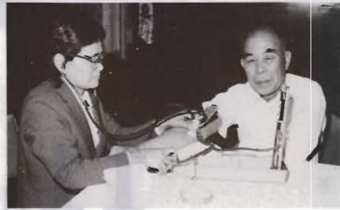
年一回は、必ず定期検診(健康相談で)

成人病は、早期発見による適切な治療がとくに望まれています。そのため市では、各種の集団検診や健康相談に力を入れています。