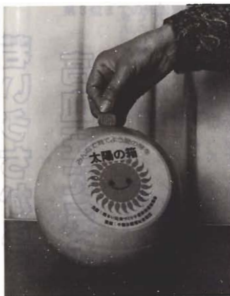
温かい心を持つ太陽の箱

黄色い、こんなかわいい丸い「太陽の箱」と呼んでいます。箱をご存知ですか。これを「太陽の箱」と呼んでいます。手業市にある、明德女子短大