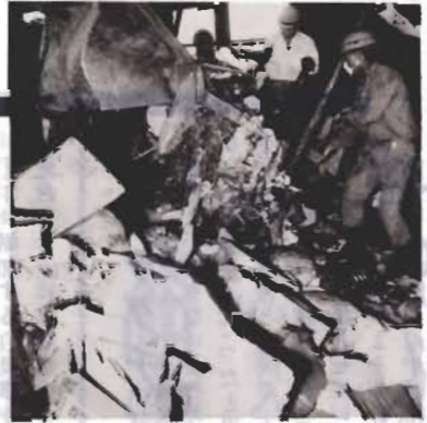
押し寄せるごみ(正木処理場で)

精神薄弱者通動寮 昼は、職場に勤め、夜は寮で生活上のいろいろの指導をする施設です。 精神薄弱者更生施設 社会で働くため、訓練や指導を行う施設です。 精神薄弱者授産施設 社会で働くことの困難な人が、仕事を覚えたりする施設です。小規模な施設として、福祉作業所があります。 施設は、全国的にも数少なく入所申請をしても待機期間が長いのが実情です。今年十月にオープンしました館山市福祉作業所は、定員十九人ですが、まだ余裕があります。費用は、無料です。福祉作業所以外の施設は世帯の収入によって、費用の一部を負担していただきます。申請は、市福祉事務所福祉係へどうぞ。