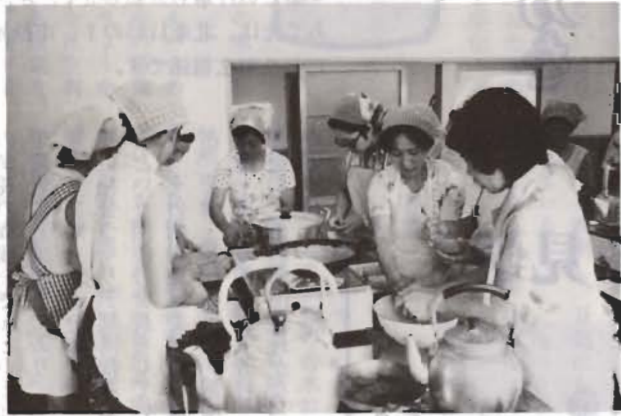
成人病を予防するための献立を指導(調理講習会で)

発作を起こす場所にトイレがあけられます。トイレは暖かくし、できれば洋式で、リキまず排便するのがよいでしょう。入浴は、四〇度前後のぬるめの湯かげんで、ゆつくり時間をかけましょう。熱い湯に、いきなりとび込むことは、絶対に避けましょう。高血圧の人には、サウナ風呂などはいけません。入浴後は、保温に気をつけ、早めに床に入りましょう。