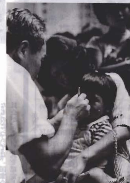
むし歯はないかな……

一歳六か月児の健康診査を行います。一歳六か月ころは、からだや心の発育に大事なときです。病気を早く見つけて指導します。 対象 五十二年十月一日から十二月三十一日までに生まれた子。 日時 六月十四日(木)午後一時三十分から二時まで受付。 会場 市民センター 持ってくるもの 母子手帳、配布した問診票、問診票の一枚から三十七までは、必ず記入してください。 注意 問診票は、各地区の子保健推進員を通じて配布します(一部地域は郵送)。転入・転居などで、六月九日までに届かないときは、市役所保健課へ連絡してください。 たり、生活習慣の自立や栄養など育児に関する相談を受けます。次の日程で行いますので必ず受けてください。