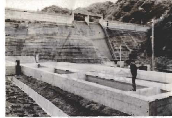
薬を使って汚れを沈めます

本市北部と、富浦町、三芳村に給水する、三芳水道企業団の増設浄水場(三芳村)に、新しい沈でん池が完成し、四月十日から運転を始めました。これはダムから取った水を、四時間三分かけてゆっくり流し、汚れを沈でんさせるものです。これまでの沈でん池は、九十分で沈でんさせる高速式で、処理時間も短かく、場所も狭くてすみません。しかし、底にたまる汚泥を、三分おきに流さなければならぬという欠点がありました。「いつも川がにごって困る」「改良できないか」と、地元三芳村の人たちから要望が寄せられていました。新しい沈でん池は、横流式といつて、処理時間も長く広い場所も必要ですが、汚泥は一月か、二か月に一度流せばよいので、川も「毎日汚れている」ということはなくなります。処理能力は、これまでと同じ一日六千リットル。高速沈でん池も、予備に使うため、化粧なおしをしています。