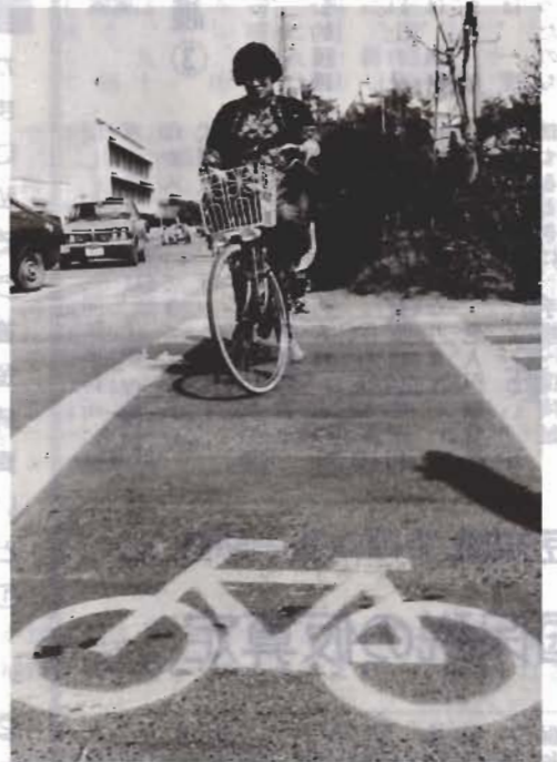
これが横断帯のマークです

はで、見かけないマークだけ車との接触事故が起きやすいの れど、これは何でしょう。正解 で、事故を防ぐために、ちかご は自転車横断帯。交差点の、ま る市内の交差点にお目見えしま 申近くなる自転車と渡ると自動 した。自転車横断帯のある交差