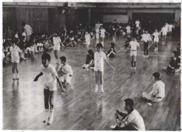
リズムカルにビョンビョン跳ぶ小中学生