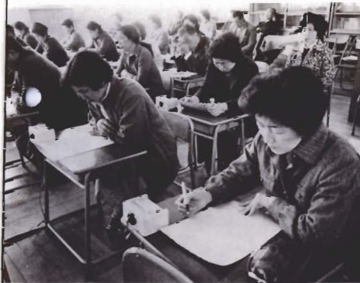
統合の説明資料を読む出席者(2月7日、豊房小学校で)

問い 各地区で話し合ったところ、「統合自体に反対」という意見はないようでした。しかしスクールバス運行を含めた通学方法や通学路の安全問題と、生徒指導の心配が多く出されました。各地区の要望は、できるだけとり入れたいと思います。地区の人が集まって「教育委員会の話を聞きたい」ということであれば、いつでも行きます。ご連絡は学務体育課(二二三二二一内線二〇四)へどうぞ。