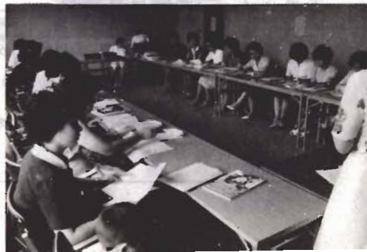
熱心に話し合うモニター(生活教室で)

市は、消費生活モニターを募集しています。このモニター制度は、消費者の生活実態の調査や意見・要望などを行政に反映させるためのものです。消費生活に関心のある人の応募をお待ちしています。 募集要領/市内に住所のある二十歳以上の女性。任期は一年で、募集人員は二十人。 仕事の内容/市で、お願いする調査に協力する。市からの質問事項に回答する。消費生活全般の意見や要望などを随時報告する。研修会に出席する。 謝礼金/年間一万円 応募される人は、三月三十一日までに、商工観光課(二二二)へご連絡ください。