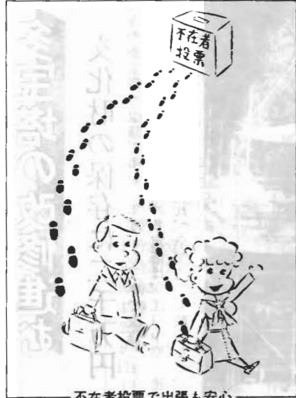
不在者投票で出張も安心

二月二十六日現在、市営水道作名ダムの有効貯水量は、二十四万五千七百七十。満水時の四二%、三芳水道の増間ダムは有効貯水量二十六万八千八百四十。満水時の五四%です。たくさん水を使う夏場に備えて、節水にご協力ください。