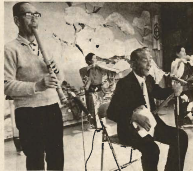
▲ラシのノドはどうだ。踊りもさすが(老人福祉センターで)

生活の喜びを高めていただくための運動会です。館山市からは十八人が参加します。雨天でも九十八人、安房郡市全部で三百三