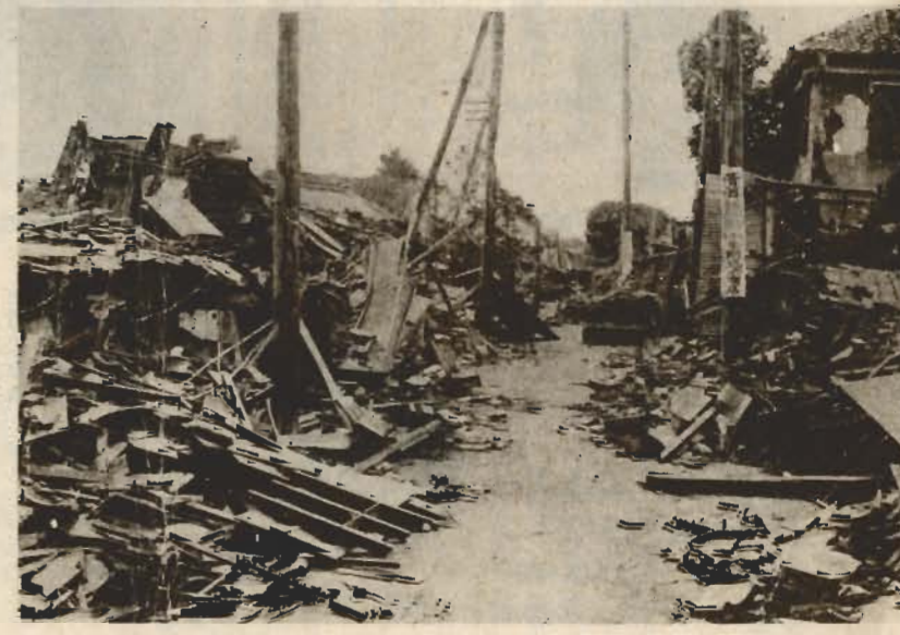
▼関東大震災の惨状 (市内那古)

【解説】市の統計と、図書館よりは、つこうで一回お休みします。 ○先月号六ページ、特別養護老人ホームにタオルを寄贈の記事中、寝たきり老人の入浴が「月一回くらい」とありましたが「最低でも月二回、ふつうは十日に一回」が正しかったと、同ホームから申入れがありました。