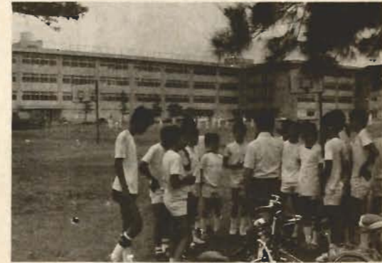
▲整備された校舎(二中)

市では、生徒のみなさんが、よい環境で、楽しく勉強できるように、計画的に木造校舎を、鉄筋コンクリート造りに建て替えています。 今までに、北条小、館山小、神戸小、豊房小、幼、一中と二中の校舎が完成しました。 昨年完成した、一中と二中の生徒から「明るくてきれいだ」「防音校舎なので、外からの騒音が入らず静かだ」「特別教室の設備が整っていて勉強が楽しい」「いつまでも新しさを失わないように大切にしたい」などという声があります。 本年度は、那古小(一一〇〇平方メートル)、富崎小・幼(一八八七平方メートル)、館山小講堂(八三二平方メートル)そして、過日落雷で焼失した、東小校舎の一部復旧などに、約四億円をかけて改築に乗りかかっています。