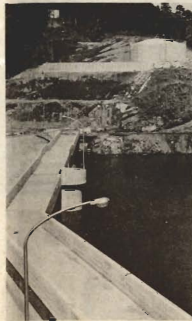
▲満水になった作名ダム

△上水道 特に急ぐ必要がある事業として努力してきましたが、今年の夏には、一部通水の見通しがつきました。さらに来年度から実施しています。救急医療体制の完全実施の意味からは、いづらか問題は残しているものの、市民生活にかけがえのないことであり、段階的措置として踏み切ったものです。 △住宅 低所得者層を対象にした市営住宅を10戸建設します。 △道路 補修・改良を進め、バスの早期実現に努力します。 △テレビ中継放送局 市内の電波障害解消のため、放送局と協議した結果、今年度中継局が建設され、難視聴が解消されます。