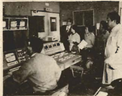
▲放送センターも見学

私達の生活と密着した、し尿ゴミ・水道や教育施設を見学します。あなたもどうぞご参加ください。先着23名でしめ切ります。