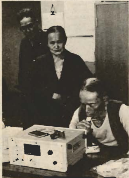
▶もつと吹いて、もつと吹いて！(肺機能検査)

このほど、厚生省と日本医師会の共催で、老人健康診査が行われました。これは、今後の老人福祉政策を立案するための基本的調査として、全国7カ所の指定地域の一つに、館山市が農村地帯として選ばれたものです。対象になった安東(33人) 二子(34人) 清水の一部(5人)の65歳以上の方72人は、医療センターなどで、体力、知能、内臓機能など全体的検査を受けました。