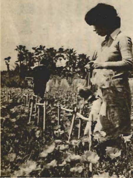
▲花つみ園も宿泊型観光に役

質問 船形港の給水管が細く、外来船の水揚げ寄港が減っているのではないか。 答 現在の給水施設を改善する必要がある。漁協長と協議した。組合内部で規模や構造などを検討して実現を図りたい。