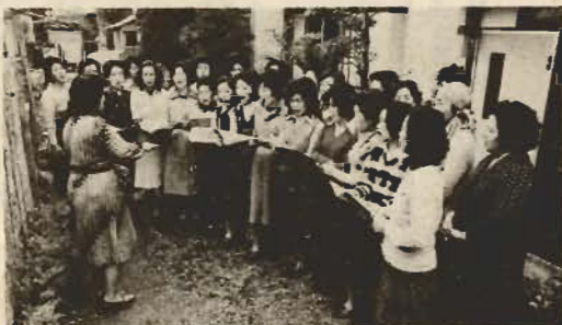
練習にはげむママさん達