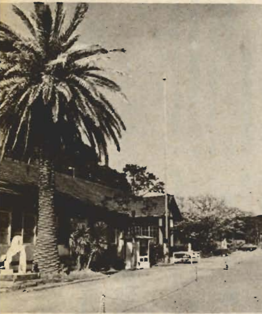
▲改築される那古小

△改築される那古小 道八百メートルを舗装します。さらに作名ダムから育成牧場への林道が実現されることになり、山林資源の開発と観光の両面から、完成が期待されます。 △水産業 厳しい環境に処するため、施設整備を図っています。今年度も生産基盤である漁港整備を重点にします。また漁礁などの造成と、種苗放流で