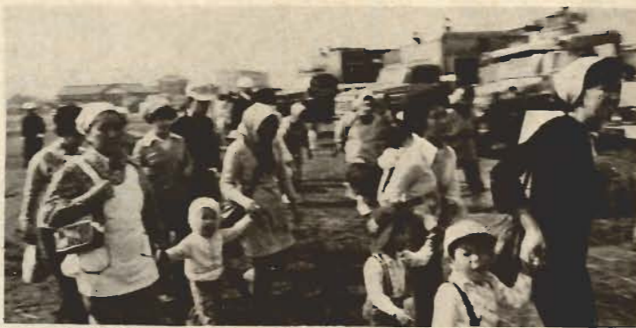
▲警察官・消防団員の誘導で避難する住民