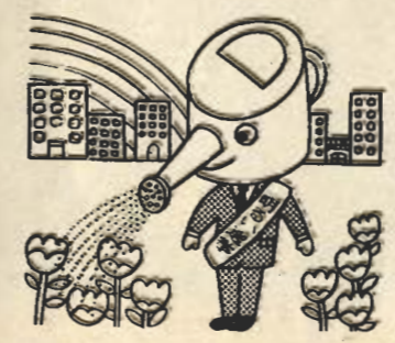
投票する時は必ず入場券をお持ちください。

昨年の公職選挙法の改正で、候補者は今までの「選挙運動用通常ハガキ」のほかに「選挙運動用ピラ」が配布できるようになりました。 配布できるピラは、県選管の蓋紙を貼付したものの2種類以内です。 このピラは候補者と新聞販売店の契約により折込みで配られたり、立会演説会場の入口、個人演説会や街頭演説の場所などで配られます。 候補者を選ぶための資料として、ご利用ください。