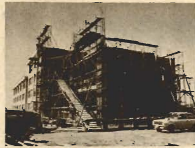
▲一中工事も来年3月には完成