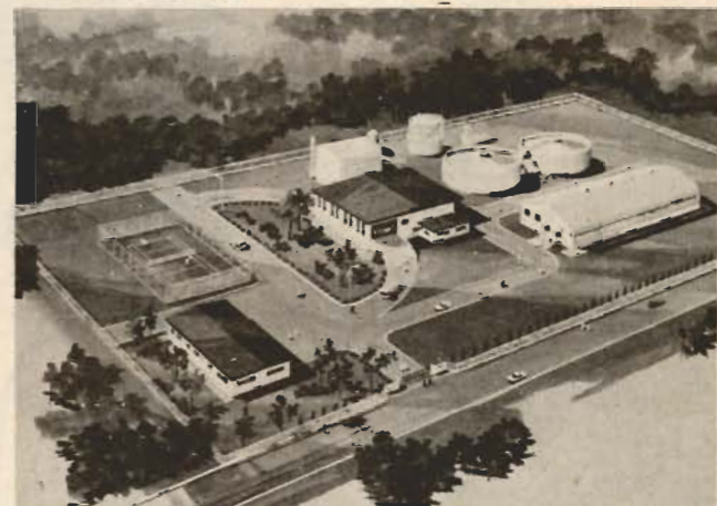
▲近代的な処理施設の一例

現在、館山市が当面する緊急課題の一つとして積極的に進めている「衛生センター」の建設計画については、8月号広報でお知らせしましたように、水利の便、周囲環境の問題、更に、くみ取り業務を円滑に行うための交通距離の問題などを充分考慮して、市内上真倉字日坂地区を建設予定地に選り地元の方々と現在交渉中です。しかし、なくてはならない施設でありながら、一般的には「処理場は臭い、汚い」というイメージが非常に強いのも現実です。そこで市では「百聞は一見にしかず」の立場からこれらの最新施設がどんなものであるかを理解していただくために、関係者の皆さんに先進地の施設を直接見ていただくことを計画しています。 10月に長野県佐久平環境衛生センターと新潟県舞平処理場を担当者が視察してきましたが、両施設ともすぐれた施設であり、市内の関係者の方々にみていただければ従来の処理場というイメージを一新していただけたらと思います。