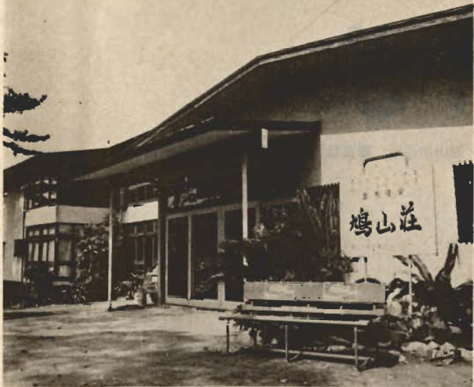
▲鳩山荘も同外装を化粧なおし

不当な価格では、当然買取できない。公正な機関で価格を決定したい。ゴミ処理場については、今後検討の余地がある。