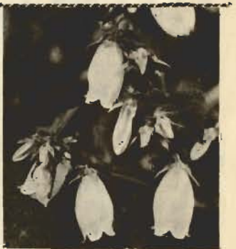
初夏の訪れと共に山野の木陰や主手を特異な形の花で色どってくれるききょう科の多年草で、時には短いランナーを出して増えもする。根元からの葉は長柄を持つた卵心形だが、上部にゆくに從つて無柄三角状になり、莖葉共に毛が多い。