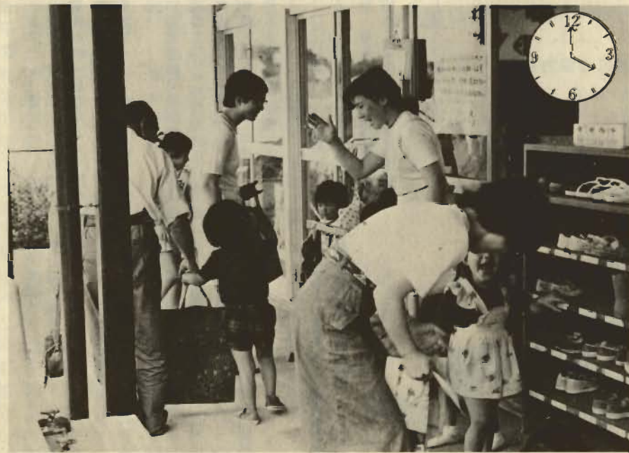
降園——バイバイ。またあしたも元気でね。喜んで帰る子、帰らないとグズる子。

長時間保育を希望する子供は、このあと、自由に遊びながら残り子供達の声完全に消え、保育園の一日が終わるのは5時30分。