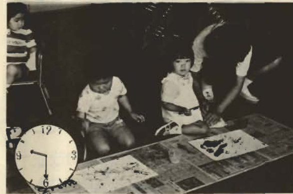
お絵書き——うーん。絵を書くのほむずかしいな。カラでみせできないのが残念です。

よく「子供は親のもとで育つのが一番だ」と言われ、また多くの母親が「子供は自分の手で育てたい」と言っている。しかし現実には、共働き、病気などの理由で両親が直接子供を育てられないことも多い。そういう子供達を親にかわって見るのが保育園。人間形成の重要な基礎である幼児期を母親にかわって担う保育園の責任は大きい。市民の要望とともに、自治体の仕事は広がり、保育園だけを見ても数（現在公立6私立5）園児数（4月1日、0才9人、1才50人、2才192人、3才233人、4才200人、5才59人、計743人）保育時間（最長8時～5時30分）となっている。保育園で子供達ほとんど一日をすごすのだろうか。0～3才児専門の中央保育園に取材して、子供達の一日を紹介します。