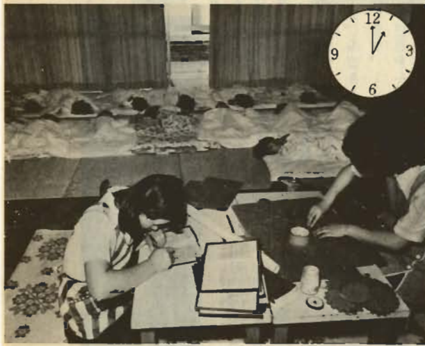
お昼寝——ぐっすり眠る子供達を見守りながら、保母は家庭との連絡ノートをつける。