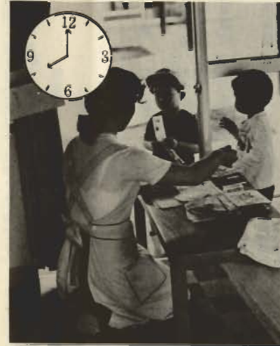
朝の視診——一目の始まり。子供の顔色、態度、熱の有無などを見て今日の健康状態を判断します。

よく「子供は親のもとで育つのが一番だ」と言われ、また多くの母親が「子供は自分の手で育てたい」と言っている。しかし現実には、共働き、病気などの理由で両親が直接子供を育てられないことも多い。そういう子供達を親にかわって見るのが保育園。人間形成の重要な基礎である幼児期を母親にかわって担う保育園の責任は大きい。市民の要望とともに、自治体の仕事は広がり、保育園だけを見ても数（現在公立6私立5）園児数（4月1日、0才9人、1才50人、2才192人、3才233人、4才200人、5才59人、計743人）保育時間（最長8時～5時30分）となっている。保育園で子供達ほとんど一日をすごすのだろうか。0～3才児専門の中央保育園に取材して、子供達の一日を紹介します。