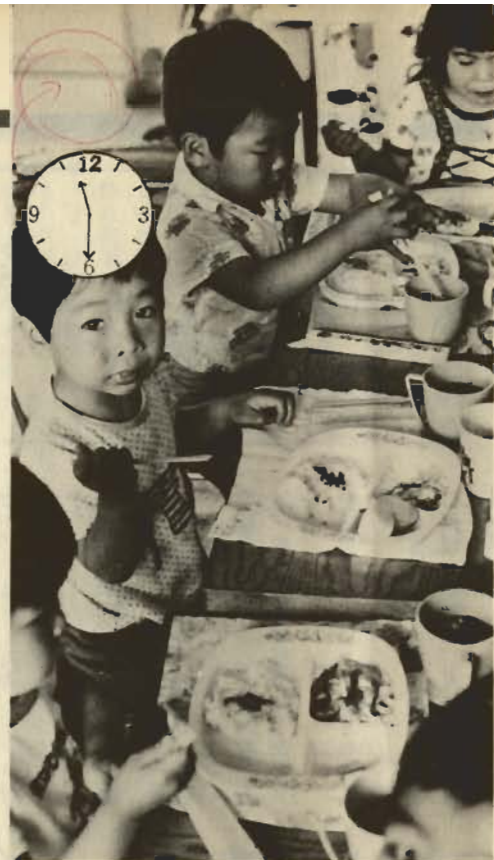
給食——一番うれしい時間。ホク残さずみんな食べちゃうよ