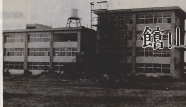
↑ 52年3月に全工事が終わる一中の防音校舎新築工事。