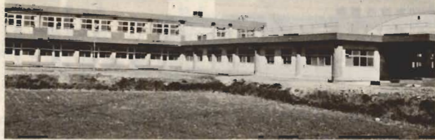
↑ 寝たきり老人が安心して余生を送れる特別養護老人ホーム

ことし四月から失業保険法にかわり新たに雇用保険法が施行されました。この法律で特に季節労働者のみなさんが失業したときは、その生活実態にあわせた特例一時金が支給されることになりました。 (受給できる人) ①季節的に雇用される人、②毎年一年未満の短い期間だけ就労する人、のどちらかに該当する人に限られますが、季節労働者のみなさんはこれに該当することになります。 (一時金の額) その賃金で計算した基本手当の日額の50日分(手続き) 雇用保険の手続きと同じで、居住地の公共職業安定所に離職票を提出して手続きしてください。 最低四カ月と二十二日の就労で受給資格が付きま。くわしいことは館山公共職業安定所適用係に遠慮なくお尋ねください。(☎二二二三三)