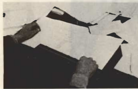
↑ 税収減で市の家計簿も赤字続き

五十年度一般会計は当初、歳入歳出共に約四五億三千万円を予定しましたが、その後三回補正し十月末現在約四六億四千万円になっています。これは前年度決算に比べ一八・八％の伸びです。 歳出では教育費が総額の二四％、民生費一九・四％、総務費一八・二％となっており、借入金元利返済金である公債費は三・九％一億八、〇六七万円、二・七％の増になっています。