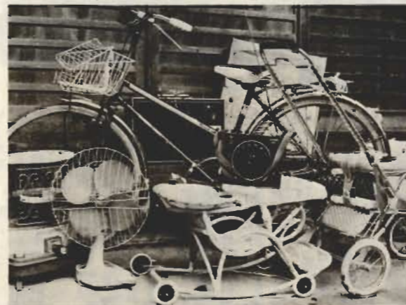
↑家庭で眠っている品物にいま一度「命」を。

家庭で眠っている使える家庭用品はありませんか。あなたに不用品でも他の人が求めているかもかもしれません。市では来年一月から不用品情報コーナーを設け、広報紙上で情報の交換を行います。 不況とインフレで家計のやりくりを痛めているみなさん。こんな品物を譲りたい!「こんな品物がほしい!」と思ったらすぐ市役所商工観光課(☎二二二二内線三四八)へお電話ください。