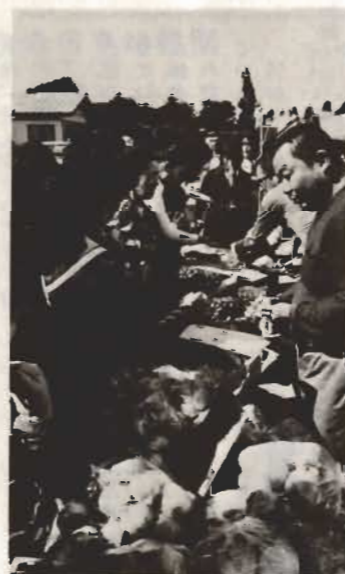
↑物価高の折り、主婦に人気があった野菜の安売り（市民センターで）

くらしを考える、物の命を大切にをテーマに、10月22日から24日まで、第四回消費生活展が市民センターで開かれました。相談コーナー、知識コーナー、修理コーナー、講演会などいろいろ催し物に会場は人でいっぱい。