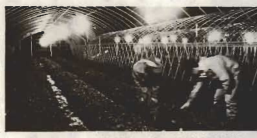
↑早期出荷をめざして始まったイチゴの電照栽培

真夜中の田んぼに、突如、不夜城出現。房州いちごの産地山本地区で房州ではじめてのヒールハウスの電照栽培が行われています。