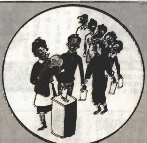
戦後第1回の総選挙(昭和21年4月) 昭和20年に婦人に初めて参政権が与えられ、選挙権は25歳から20歳に引き下げられた

私は終戦後、中国から復員して選挙権を得てから、あらゆる選挙のたびに東小学校第十投票所に一番乗りをしています。そのせいかいつも私の投票した候補者は当選しています。