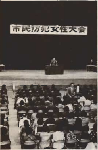
↑10月11日開かれた「市民防犯女性大会」。暴力団の追放を決議しました。

勤め先が事件のあった病院の近くなのでショックでした。白昼堂々と殺人が行われるなんて、警察はいつたい何をしているかと思いました。防犯女性大会にも参加しまし