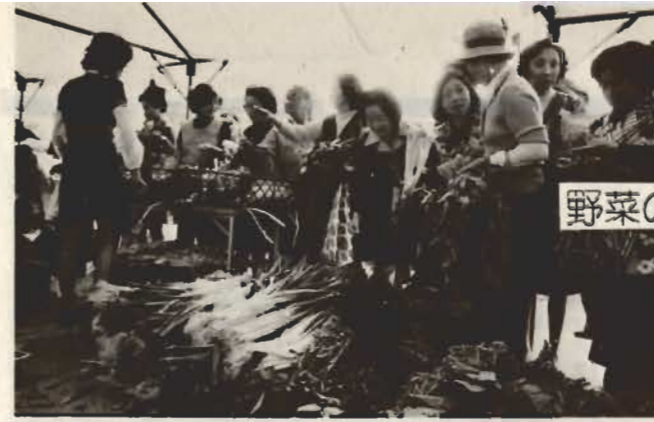
野菜の安売りなど盛りだくさん

■内職のあつせん 千葉県内職相談センターでは、内職のあつせんをしています。内職を希望する方は、なるべく五人以上のグループでご相談ください。 ▽相談場所 館山市婦人会館(☎二一七四五) ▽じかん 毎週月・水曜日 午前10時～午後4時まで。 ▽業種 電気部品組立およびハンダ付け/人員五人以上のグループ。経験不用。工賃一枚一円～二〇円。ぬいぐるみ人形ミシン縫袋/人員十人以上のグループ。経験多少要。工賃一個一三円～二五円。セーター刺しゅう(フランス刺しゅう)人員個人で可。経験要。工賃一枚三〇〇円～一、〇〇〇円。