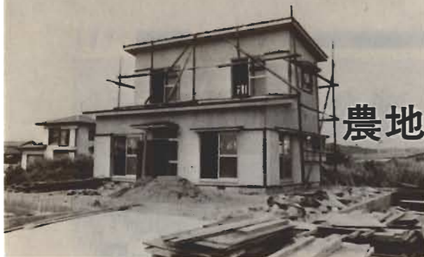
建物を建てるにはいろいろな規制があります。よく調べて着工を

田や畑など農地を買ったり、売ったり、宅地などにする例は毎年ふえる一方です。しかし、農地の売買や転用は、農地法など法律で制限され、そう簡単にはできません。 きめられた条件が備わり、きめられた手続きを行い、許可を受けてはじめてできます。 この手続きをしないと、せっかく求めた土地が登記できないばかりか、正しい売買と認められないなど、不利益や紛争のもとになります。特に売買は利害関係が生じますので、他人まかせではなく、直接、市の農業委員会の窓口でよく相談してから申請してください。 ①許可申請に必要なもの ①農地を耕地とし貸借するとき ：貸主・借主の認印。土地登記簿の謄本一通。 ②農地を耕地として売買・贈与するとき ：売主、買主の認印。土地登記簿の謄本一通。 ③農地を転用して売買、贈与、貸借するとき ：個人 双方の認印。土地登記簿の謄本一通。施設の平面図、配置図、案内図、公園、接続地主の同意書(付近が農地の場合)または農家組合等の組織の同意書(付近が水田で下水処理または農業用水の利用などに 影響がある場合)、建設費明細書、資金証明各二通。 ●法人 右の外、法人登記簿の謄本一通、定かん、決議録、決算書、事業経歴書各二通 ④自作地を自分が転用するとき ：所有者の認印の外、③と同じ。 ⑤農地の貸借を解約するとき ：貸主、借主の認印。 ⑥許可申請書の用紙は、農業委員会事務局にあります。土地登記簿の謄本は法務局で発行します。 (二注意) ▽許可申請書は、原則として申請者(たとえば売主と買主の双方)が作成、押印し提出しますが、申請内容によって書き方や添付書類が違い、また許可にならない場合もありますので、申請者ご自身で窓口へきて確認してください。 ▽市、県双方で書類審査を会議にかけ、申請によっては調査・事情聴取がありますので許可書がみなさんの手もとに届くまで二カ月から三カ月かかります。特に宅地転用などは早めに申請し、許可をうけてから工事に着手してください。くわしいことは、農業委員会窓口でお尋ねください。