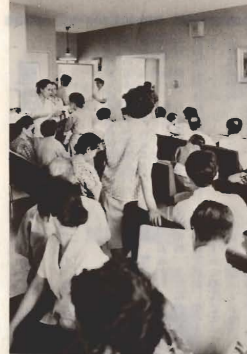
↑病院の待合室はどこもいっぱい(市内の病院で)

これは老人医療費の無料化が実施されてから、「タダだからなんでも医者にかかって、薬をもらってこよう」といった人たちが多くなったこともあり、これが大変な考え違い。医者にいかつたときは無料でも、全体の医療費がふえれば保険税引上げにつながり、そのツケは被保険者に回ってきます。老人医療の場合、かかった医療費の七割を国保で支払い、老人以外の方が病院の窓口で支払う自己負担分三割の大部分を国が持つということ。ですから医療費がふえれば、それだけ保険税も引上げざるをえなくなっています。